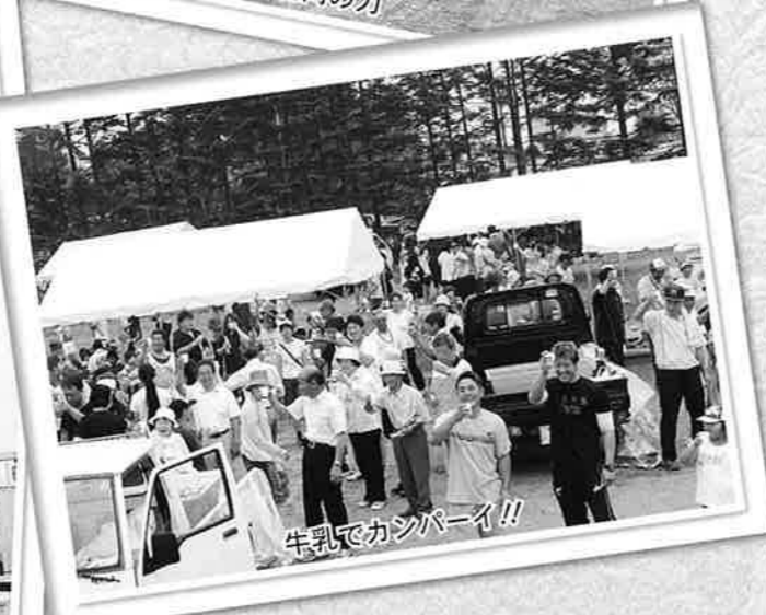
牛乳でカンパニー!!