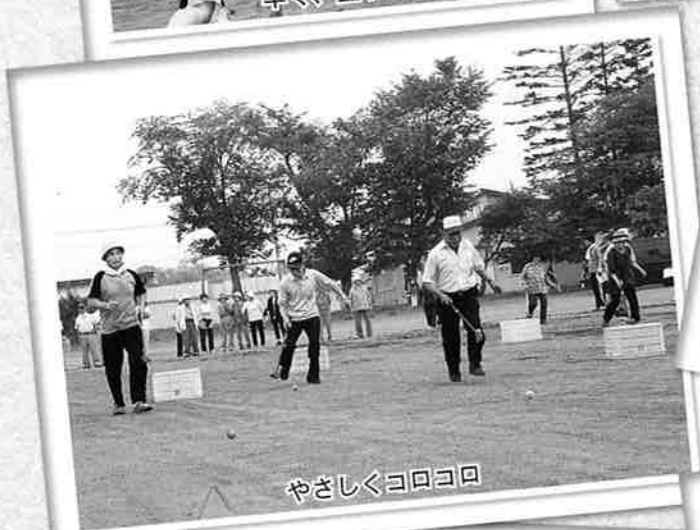
やさしくコロコロ