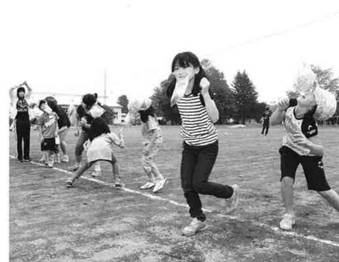
食欲の夏「元気な子」

運動会終了後は、親睦交流会が行われ、運動会名物の肉牛部会による牛の丸焼きに舌鼓を打ち、また各種ゲームで盛り上がり、参加者全員が、日頃の農作業の疲れを忘れ楽しむことができた1日となりました。