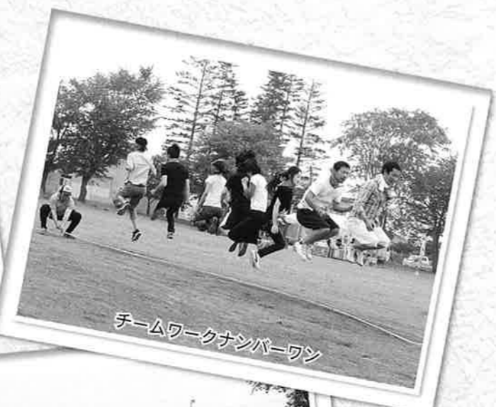
チームワークナンバーワン